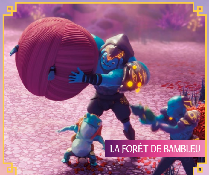
LA FORÊT DE BAMBLEU