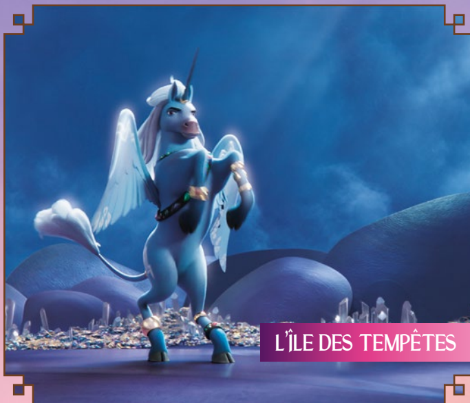
L'ÎLE DES TEMPÊTES

Centopia est un monde animé merveilleux, une île magnifique entourée d'un océan bleu foncé avec des habitants fabuleux tels que des elfes, des licornes, des Pans, des dragons et plus encore.