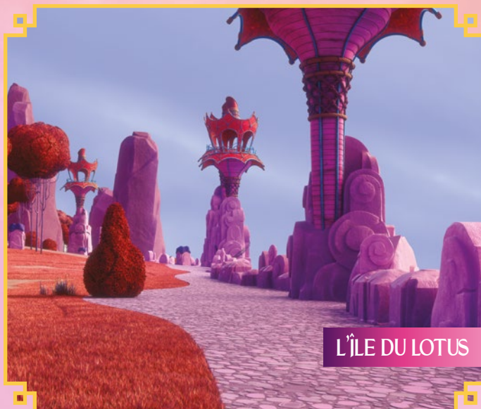
L'ÎLE DU LOTUS