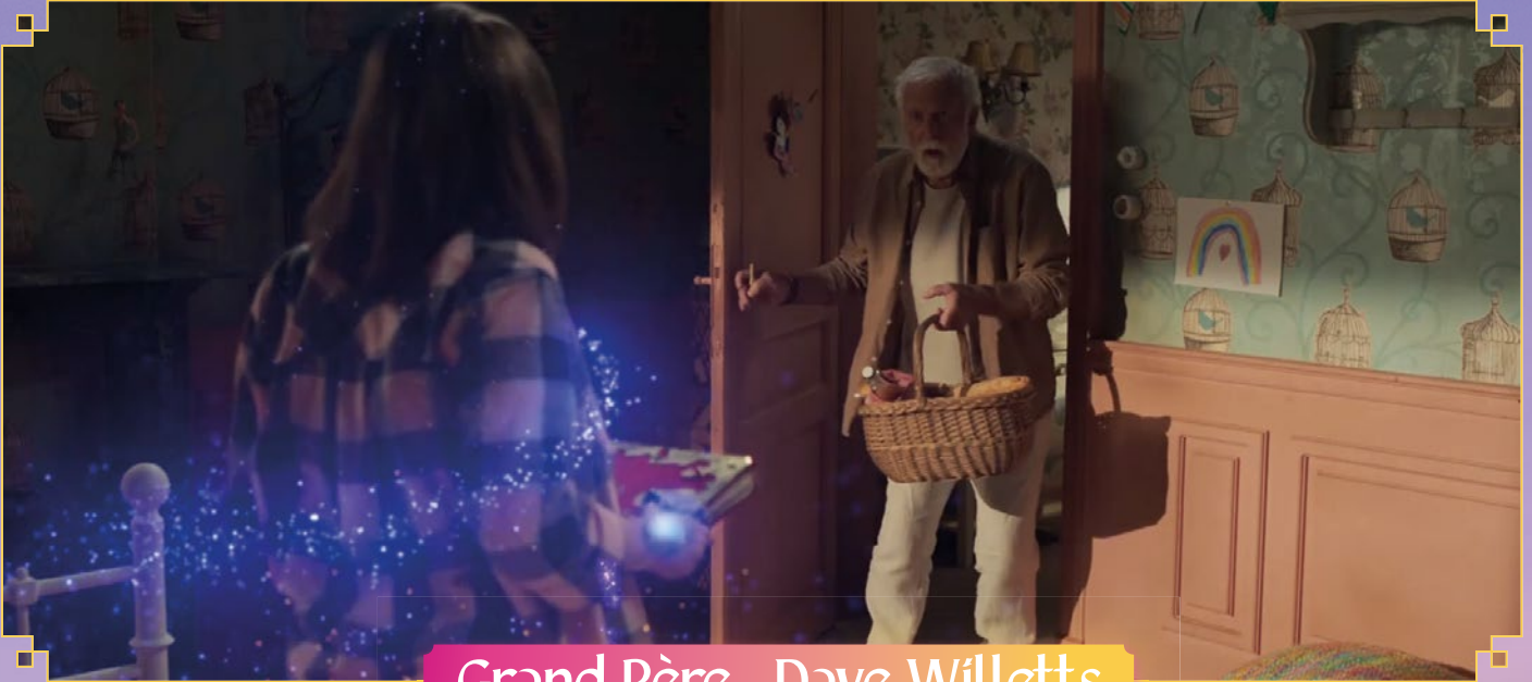
Grand-Père - Dave Willetts

Depuis plus de 25 ans, Dave Willetts est l'une des principales stars du théâtre musical au Royaume-Uni . Il a été acclamé par la critique, tant au niveau national qu'international, de l'Europe à l'Australie, pour ses nombreux rôles principaux dans certaines des comédies musicales les plus célèbres de notre époque.