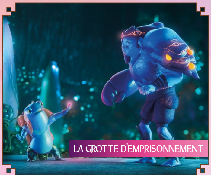
LA GROTTA D'EMPRISONNEMENT